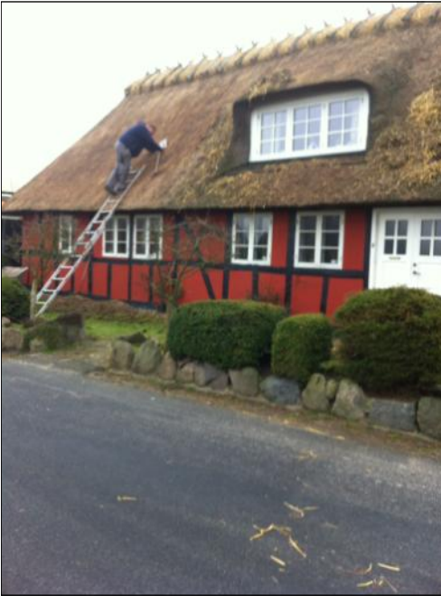
Endnu et billede med teksten: Tolderhuset tækkes