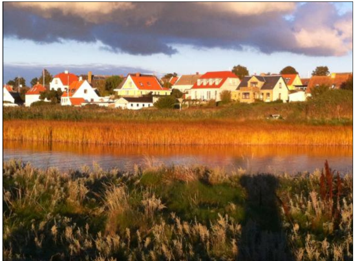
Endnu et billede